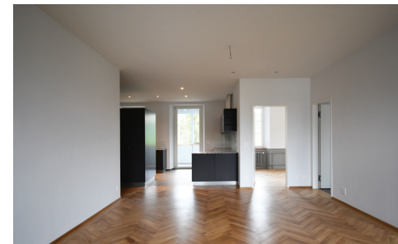
Wohnraum - Küche