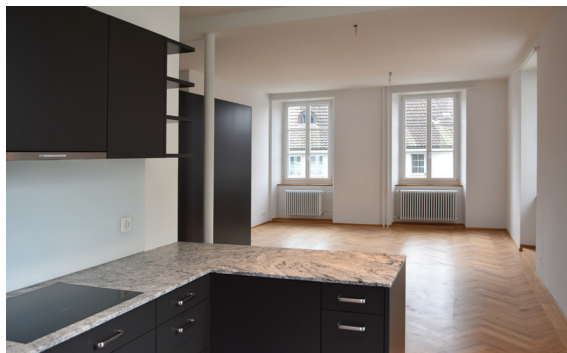
Küche - Wohnraum

Mit dem Umzug der Schulklassen in ein neues Schulgebäude stellte sich die Frage, wie das ehemalige, zweigeschossige Schulhaus aus dem Jahre 1868 genutzt werden könnte. Nach verschiedenen Studien wurde vom Gemeinderat beschlossen, das Gebäude zu Wohnungen umzubauen. Das geschützte klassizistische Gebäude musste in seiner Grundsubstanz erhalten bleiben. Durch das zentrale Treppenhaus mit den links und rechts angeordneten Klassenzimmern anerbietet sich der Einbau von je zwei Wohnungen pro Geschoss. Die großzügige Raumstruktur widerspiegelt sich in den neuen Raumkonzeption. Viele Stilelemente wie zum Beispiel die Brust-Vertäfelungen werden erhalten. Die neue Materialsierung lehnt sich dem Charakter des Gebäudes an und wird neu interpretiert. Der 1969 angebaute Windfang auf der Nordseite wird zurückgebaut, um so das Erscheinungsbild des Hauses zu präzisieren. Der ursprüngliche Vorbau wird im Erdgeschoss zum Eingang und in den Obergeschossen zu Veranden umgebaut.